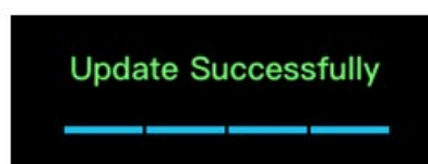
Обновление ПО завершено